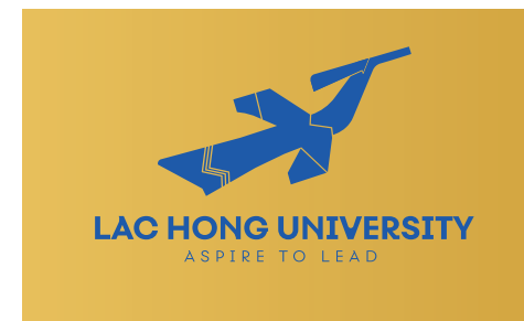
Logo trên nền nhận diện