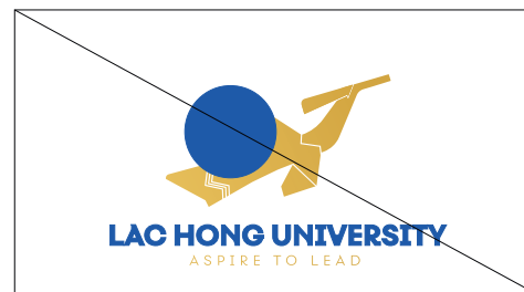
1. Không được đè vật thể khác trên logo

Vui lòng sử dụng các tài liệu được cung cấp bởi Ban thương hiệu Lạc Hồng University để tránh được những sai sót và đảm bảo được tính đồng bộ, nhất quán, chính xác cho thương hiệu.