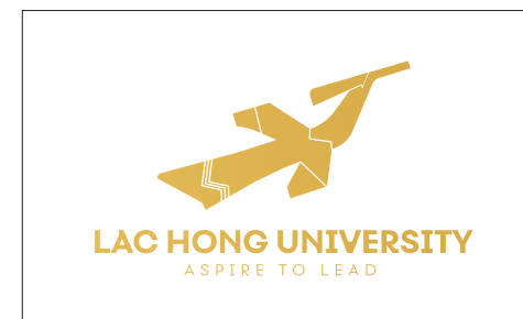
Logo màu đơn sắc tông nhận diện