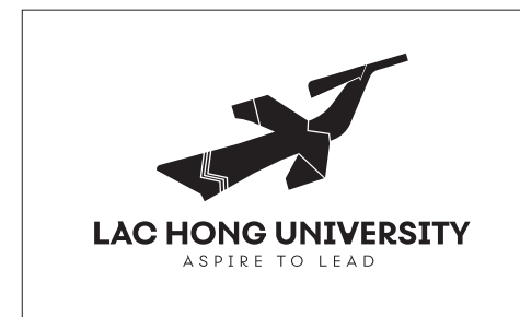
Logo dương bản