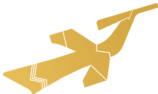
Logo tách rời tên thương hiệu