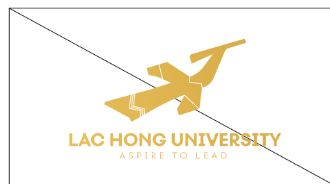
3. Không được thiết kế lại logo