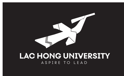
Logo âm bản

Logo có thể hiển thị dạng màu đơn sắc theo tông màu nhận diện.