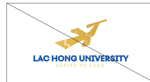
2. Không được thay đổi tương quan kích thước giữa biểu tượng và chữ của logo