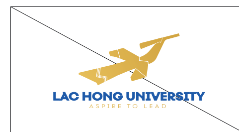
4. Không được bóp dẹt, làm dị dạng logo