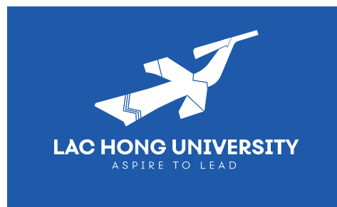
Logo trên nền nhận diện