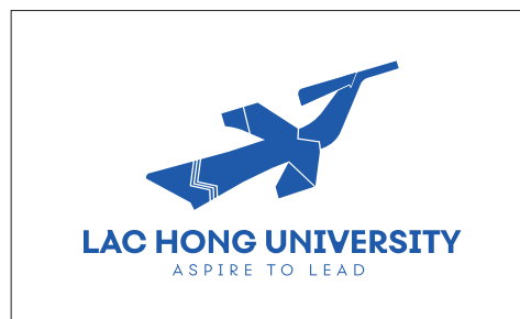
Logo màu đơn sắc tông nhận diện