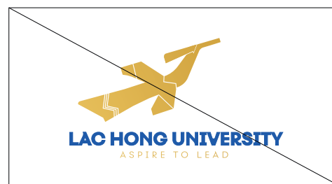
5. Không được đặt lệch phần biểu tượng và chữ